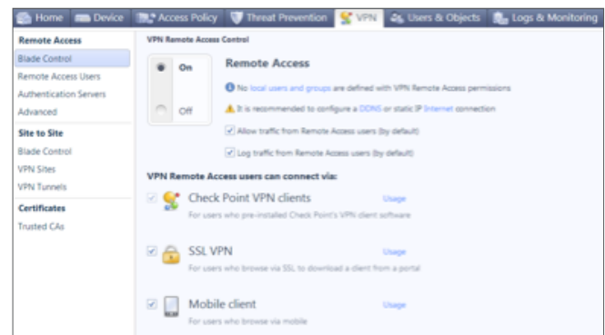
Конфигурация VPN для устройства 1100

Будьте уверены в безопасности соединений между подразделениями и удаленными пользователями посредством IPsec или SSL VPN. Предлагая несколько методов подключения (в том числе VPN-клиенты от Check Point, SSL и мобильные клиенты), устройства 1100 обеспечивают безопасное подключение откуда угодно.