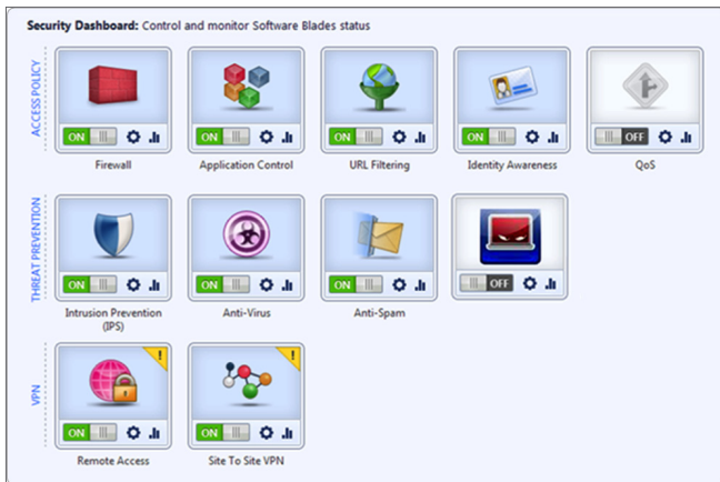
Простое и интуитивно понятное локальное управление

Простой web-интерфейс управления позволяет администраторам в считанные минуты обеспечить защиту небольшого офиса. Мастер настройки активирует предустановленную политику безопасности. Конфигурация устройства и политик безопасности производится через web-интерфейс управления. Интуитивно понятные журналы и отчеты помогают контролировать состояние устройства и безопасность.